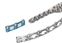
Orthopädie Knochenplatten / Implantate